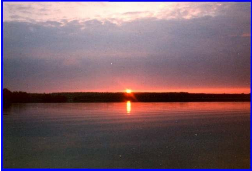
Bild från Södra Wixen - Soluppgång.